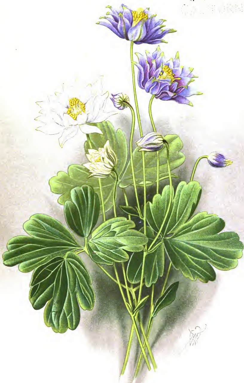
Aquilegia vulgaris L. var. stellata Hort. Голубки звездчатые.